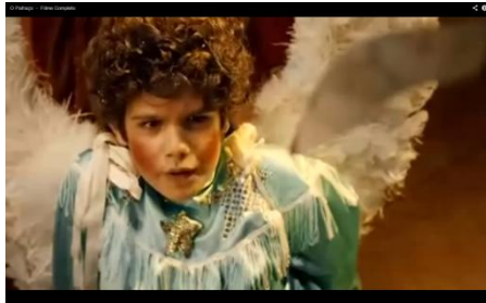
Ângulo acima dos olhos, voltada para baixo

c) Ângulo: altura e lado - É importante pensar em qual ângulo as pessoas ou objetos serão filmados, porque isso muda a sensação de quem assiste. Por exemplo, se a câmera filma de cima para baixo (acima dos olhos da pessoa e voltada para baixo), a personagem irá parecer menor, mais frágil, com medo... Se a câmera filma debaixo para cima (abaixo dos olhos da pessoa, voltada para cima) será o contrário, a personagem fica maior e se tem a sensação de que é mais forte.