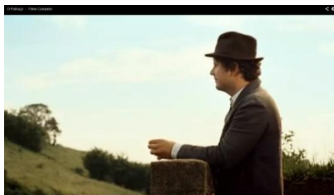
Mesma altura, vista lateral

A filmagem pode ser feita na mesma altura do objeto ou pessoa também. Pode enquadrar o objeto de frente , de trás ou de lado , dependendo da intenção do que se quer mostrar.