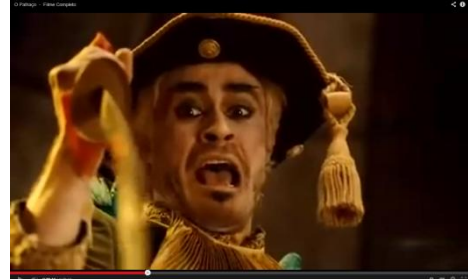
Ângulo abaixo dos olhos, voltado para cima

A filmagem pode ser feita na mesma altura do objeto ou pessoa também. Pode enquadrar o objeto de frente , de trás ou de lado , dependendo da intenção do que se quer mostrar.