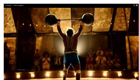
Mesma altura, vista de trás